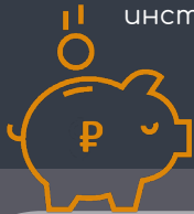
Схема реализации энергосервисного контракта (ЭСК)

Для заключения энергосервисных контрактов между коммерческими организациями, без участия государственного заказчика, законодательной базы не предусмотрено, но возможна реализация таких договоров при иной схеме, включающей кредитование, факторинг, прочие банковские инструменты.