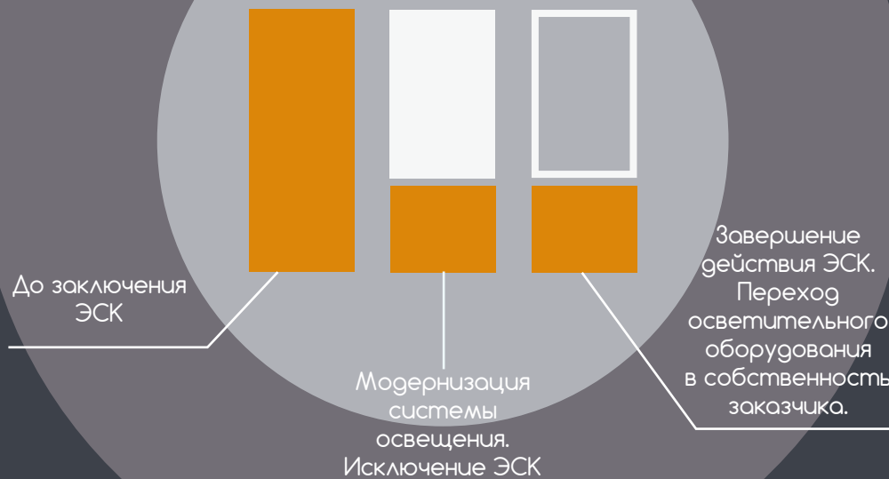
Схема реализации энергосервисного контракта (ЭСК)

Энергосервисный контракт (договор) – контракт, предметом которого является осуществление исполнителем действий, направленных на энергосбережение и повышение энергетической эффективности использования энергетических ресурсов заказчиком.